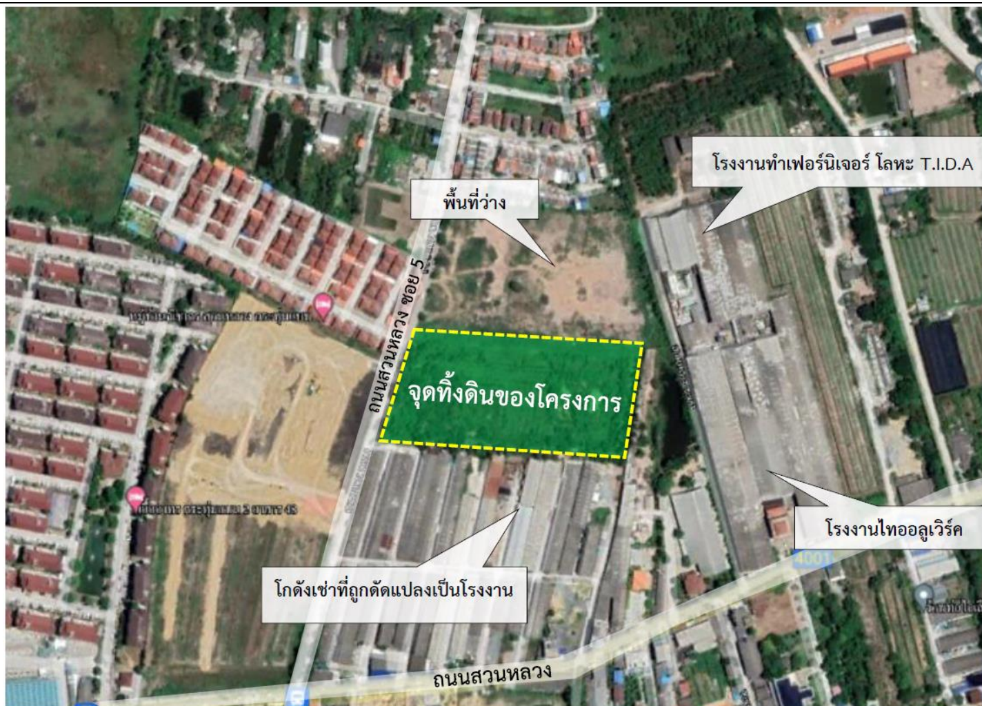
รูปที่ 2.4-1 สภาพแวดล้อมโดยรอบของจุดที่ดินเดิม